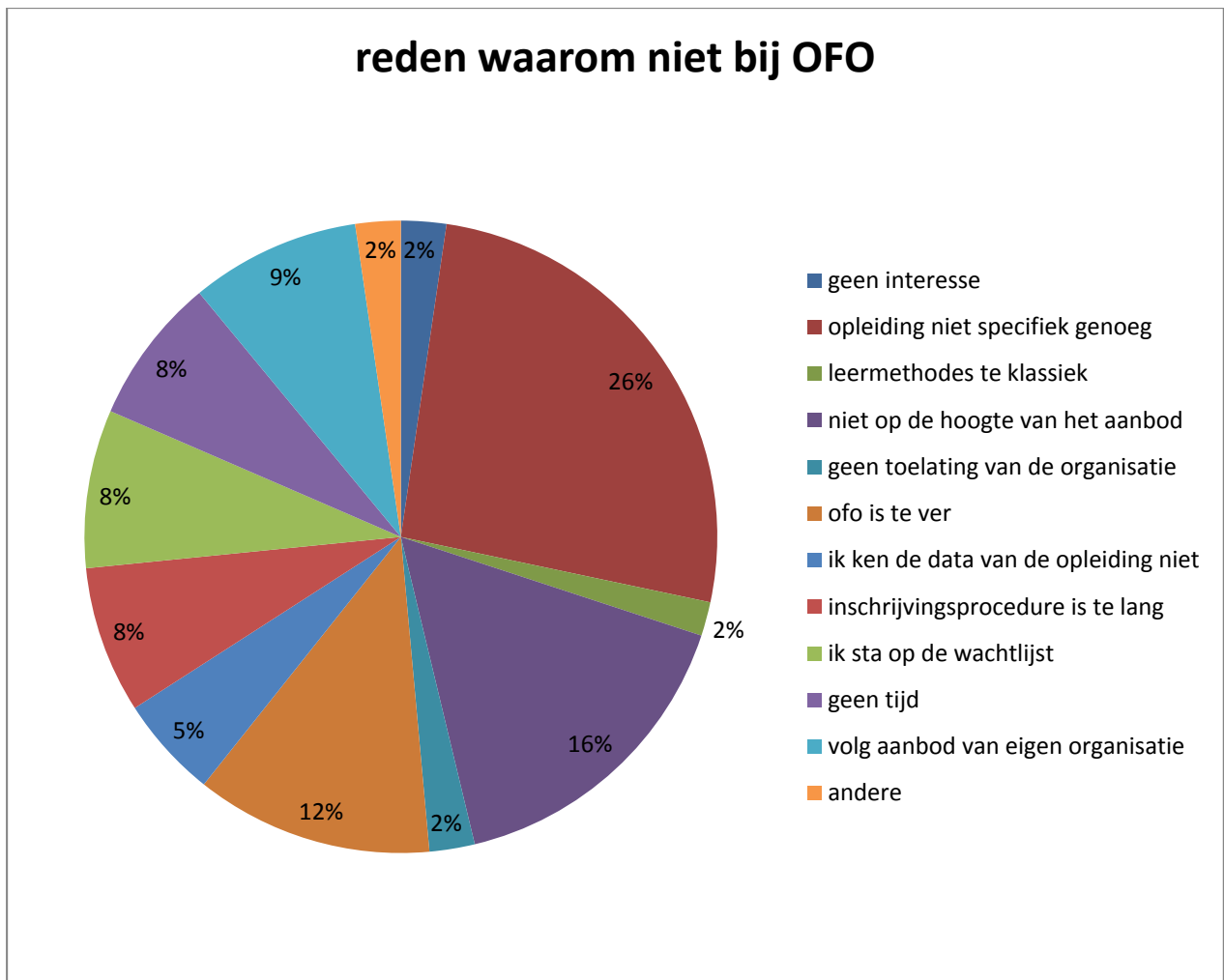
Figuur 2. Redenen waarom respondenten niet naar OFO komen.

Bijna een kwart van de respondenten gaf aan dat de opleidingen bij OFO niet specifiek genoeg zijn. Opvallend is ook dat 16% aangeeft niet op de hoogte te zijn van het aanbod. Verder geeft 12% aan dat Brussel te veraf ligt van hun werkplek. Een groot deel haalt ook de problemen aan, die gelinkt zijn aan de wachtlijsten: te lange wachttijd, het niet op voorhand kennen van de data of op de wachtlijst, ingeschreven maar nog niet uitgenodigd.